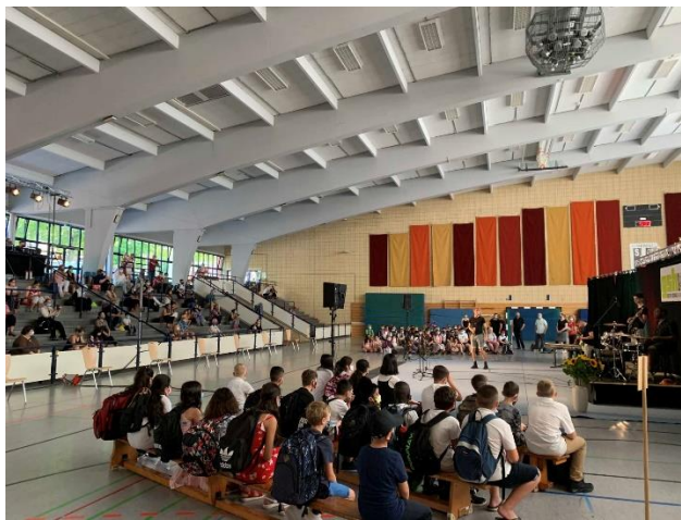
Text und Fotos: Maximilian Gillmeister

Nach diesem wunderschönen Start wünschen wir allen neuen Schülerinnen und Schülern eine wunderbare Zeit an der GSH.