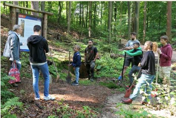
Text und Fotos: Olaf Zeiske