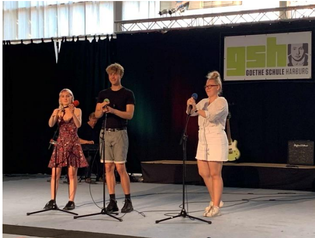
Das Gospel-Train-Trio beeindruckte